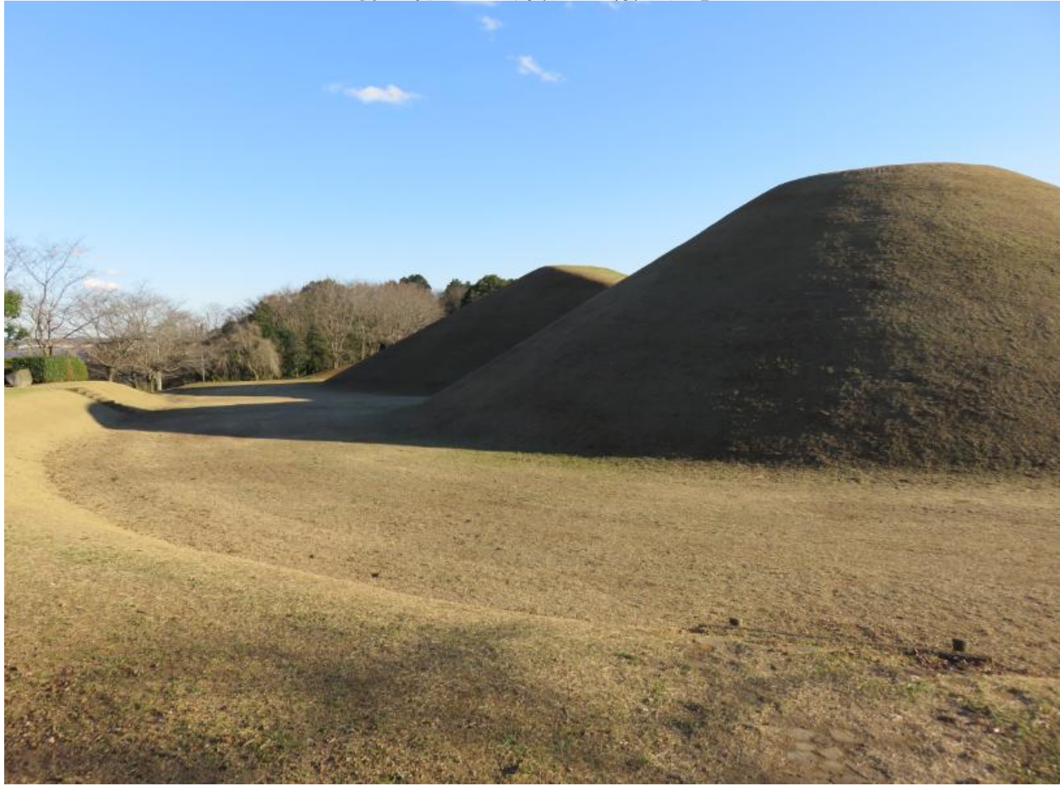
北西側から見たところ/周堀の巡る雰囲気を感じられる