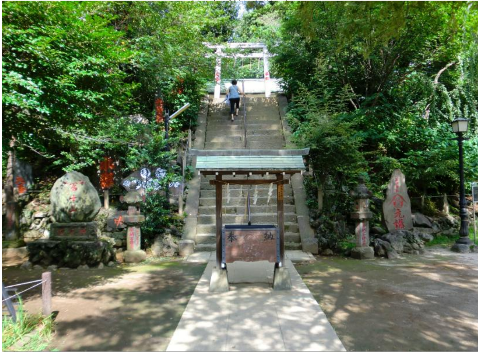
後円部の墳頂に社殿がある