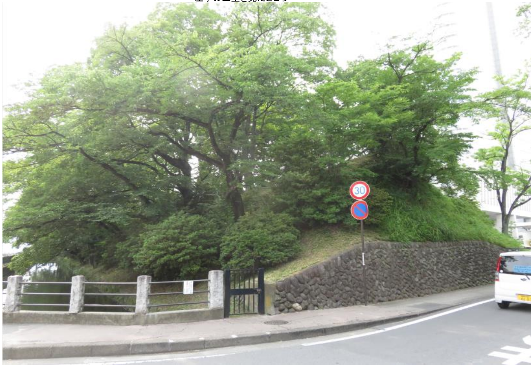
左手の土塁を見たところ