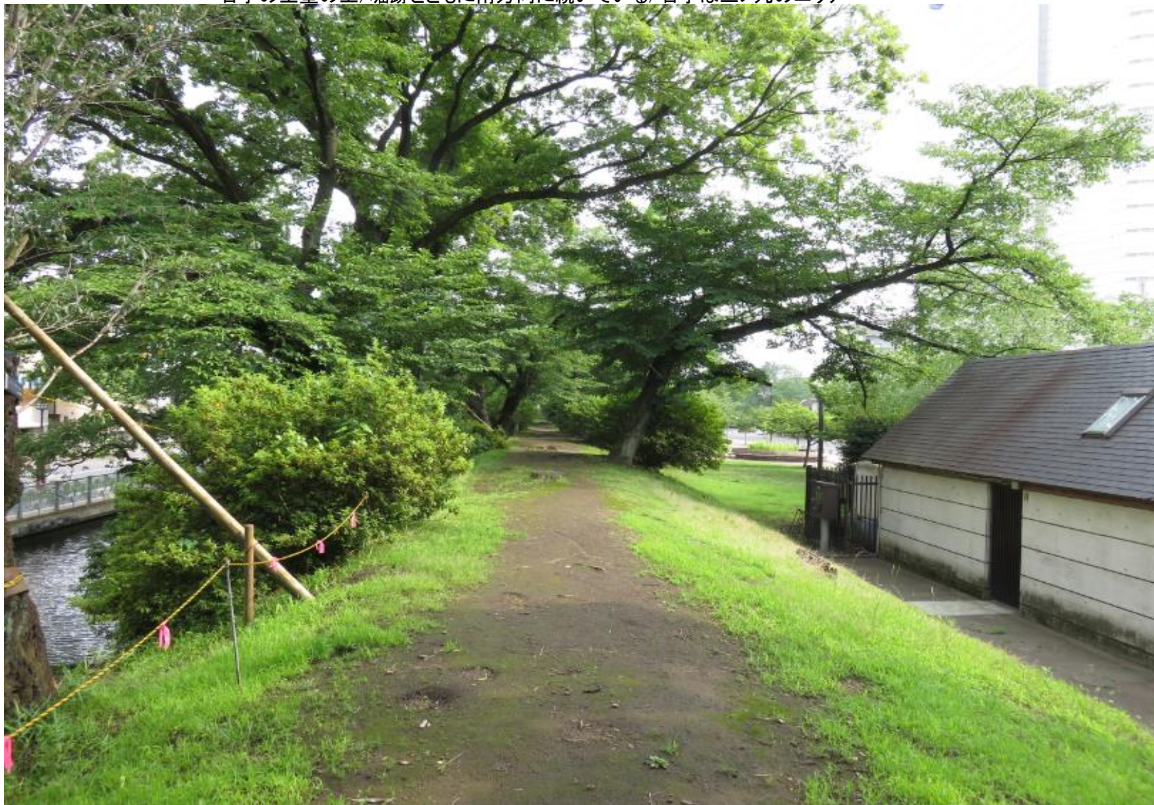
右手の土塁の上/堀跡とともに南方向に続いている/右手は三ノ丸のエリア