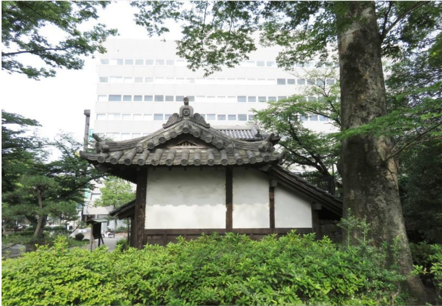
側面から見た東門