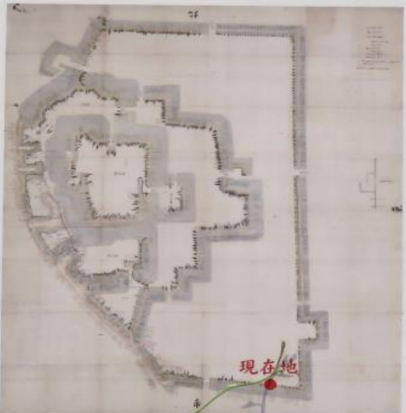
文化14年「御城御土居通御植物木尺附絵図」 (群馬県指定重要文化財 櫻井家旧蔵「高崎城絵図並びに文書」より)

さらに、兵営や練兵場を建設するために城内は整地された。このため本丸や二の丸の土塁や堀は現存しておらず、三の丸の堀と土塁がわずかに昔の面影を止めている。